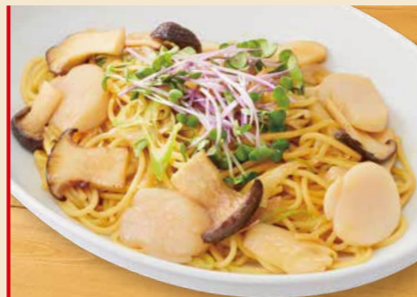
ほたて貝柱の和風パスタ 1,300円