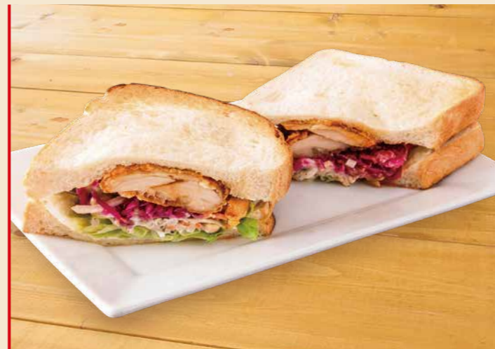
生姜がかおるチキンサンド 1,100円