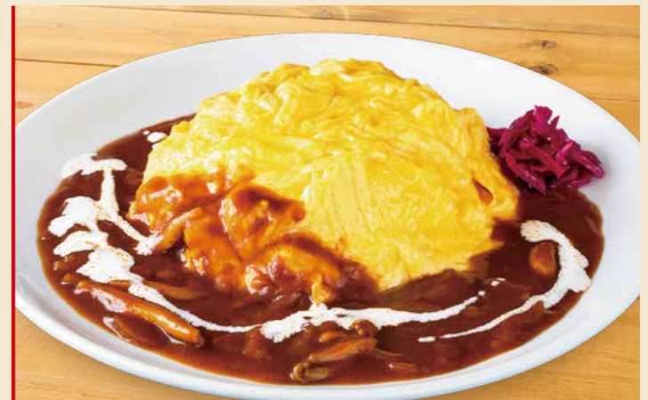
とろとろたまごのオムライス 1,200円