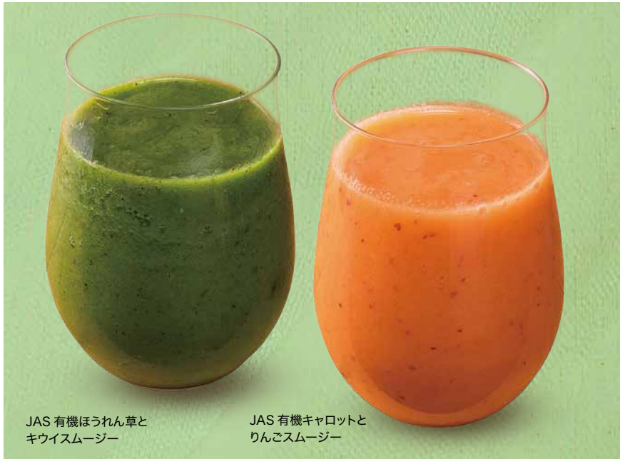
JAS 有機ほうれん草と キウイスムージー