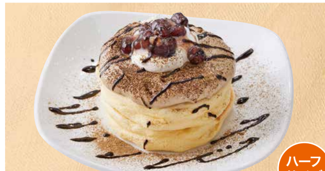
加賀棒ほうじ茶のリコッタパンケーキ