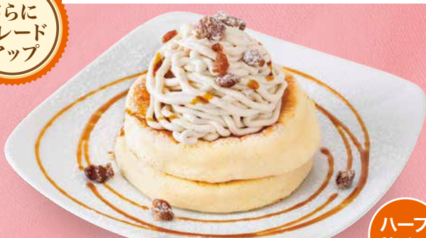
栗のクリーム リコッタパンケーキ