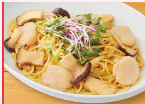
ほたて貝柱の和風パスタ 1,300円