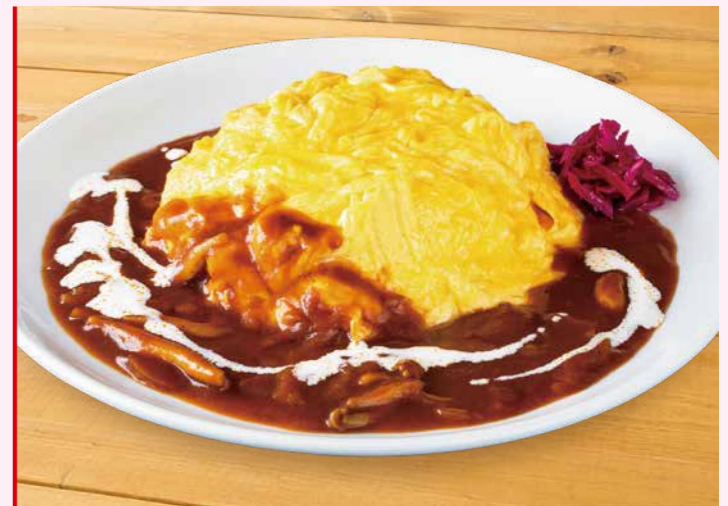
とろとろたまごのオムライス 1,200円