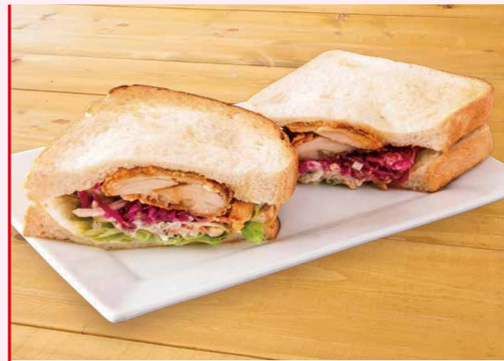
生姜がかおるチキンサンド 1,100円