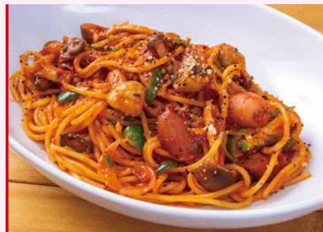
昔なつかし昭和のナポリタン 950円