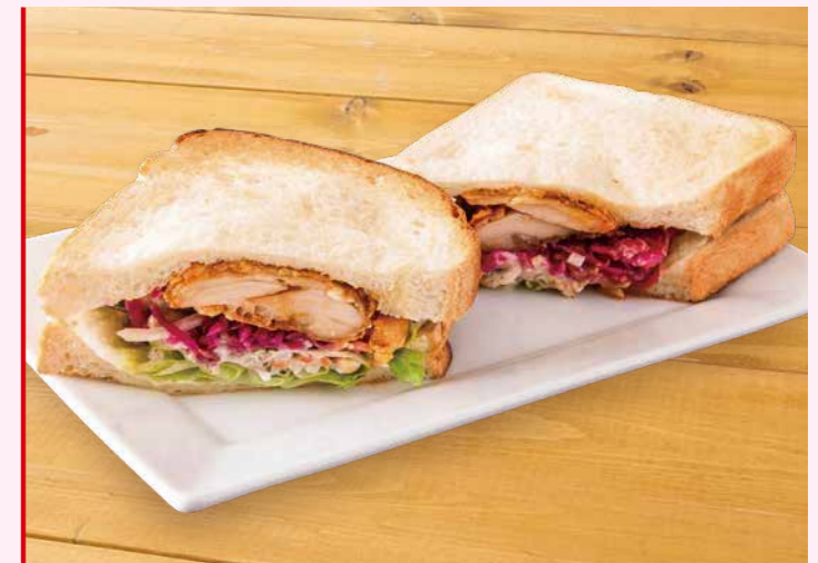
生姜がかおるチキンサンド 1,200円