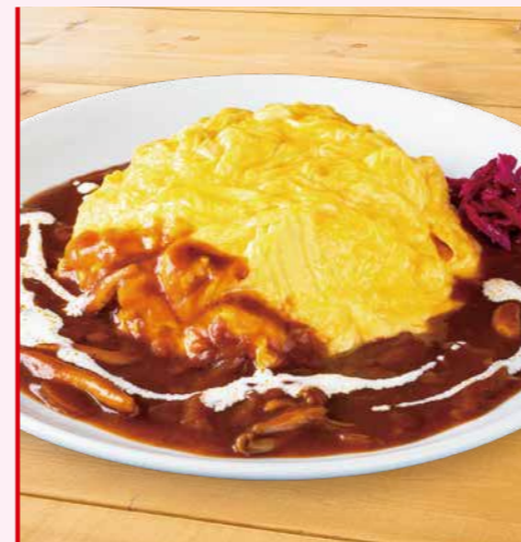
とろとろたまごのオムライス 1,280円