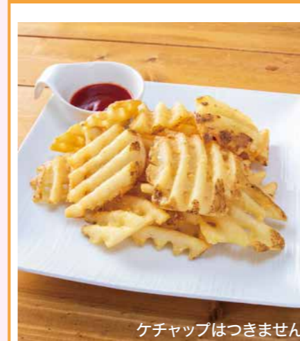
皮つきポテトフライ 450円