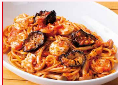
茄子とモッツアレラの自家製トマトソースパスタ 1,200円