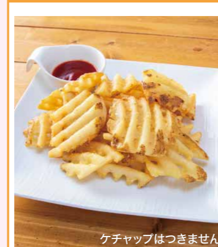
皮つきポテトフライ 480円