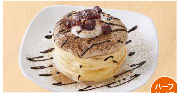
加賀棒ほうじ茶のリコッタパンケーキ