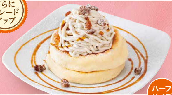
栗のクリーム リコッタパンケーキ